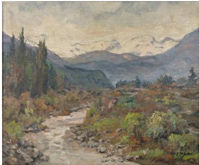
Pintura Cordillera y Río Autor: Benjamín Guzmán Valenzuela