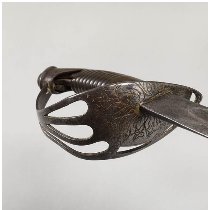
Guardamonte Espada siglo XIX