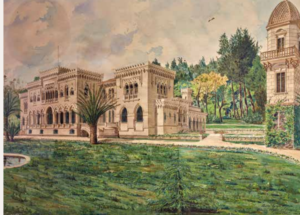
Palacio de Doña Blanca Vergara de Errázuriz - Ettore Petri Acuarela - 1910.

En 1941 la quinta y el palacio fueron adquiridos por la Municipalidad de Viña del Mar, en la ocasión la propietaria donó 60 pinturas. Ese mismo año, se crea oficialmente el Museo de Bellas Artes y comienza a funcionar en el lugar la Escuela de Bellas Artes.