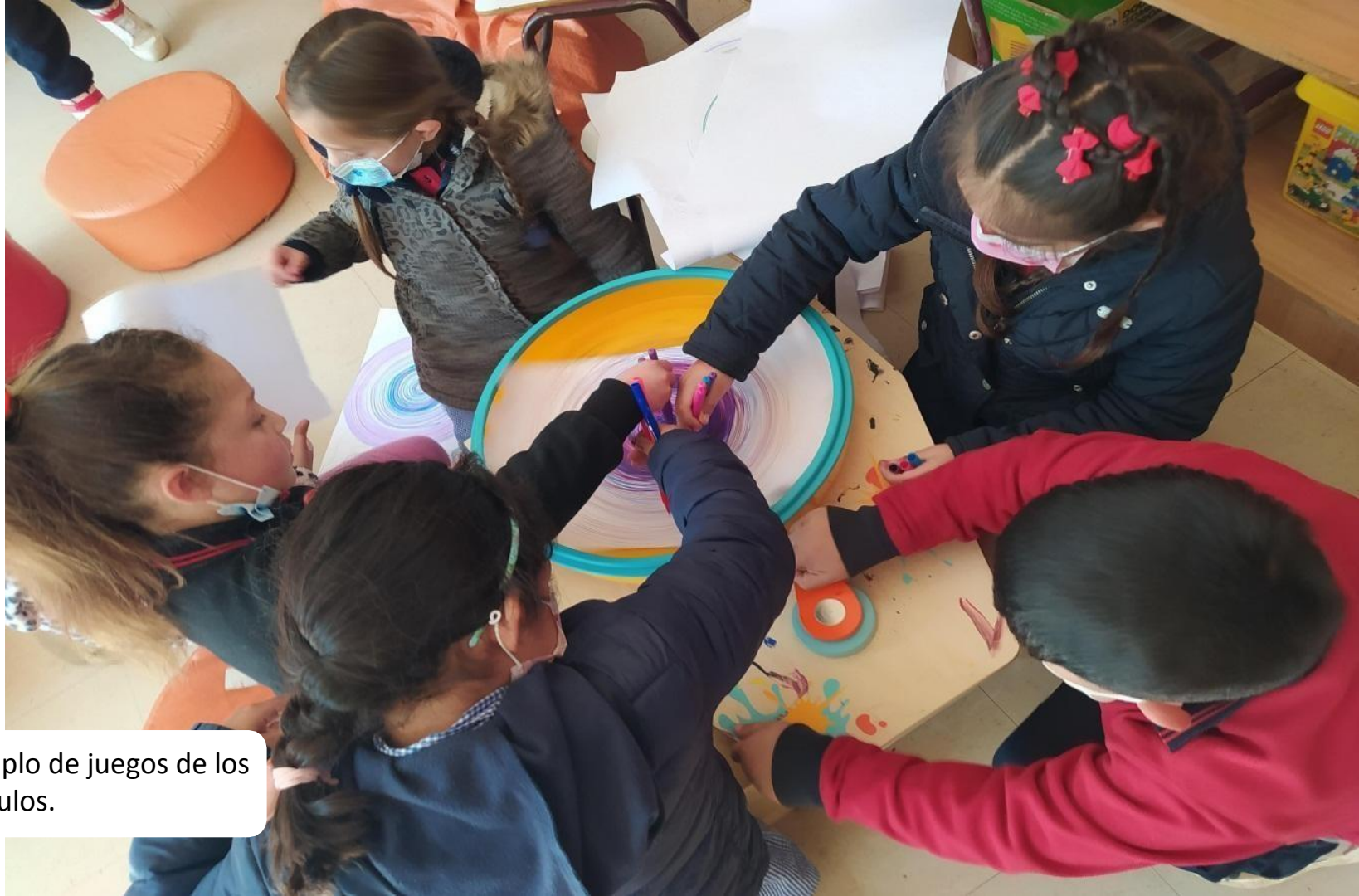
Ejemplo de juegos de los módulos.