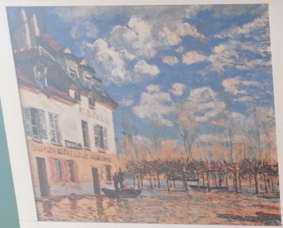
LA PARRACION EN PORT MARLY 3015 AÑO 1825 J.M.W. TURNER