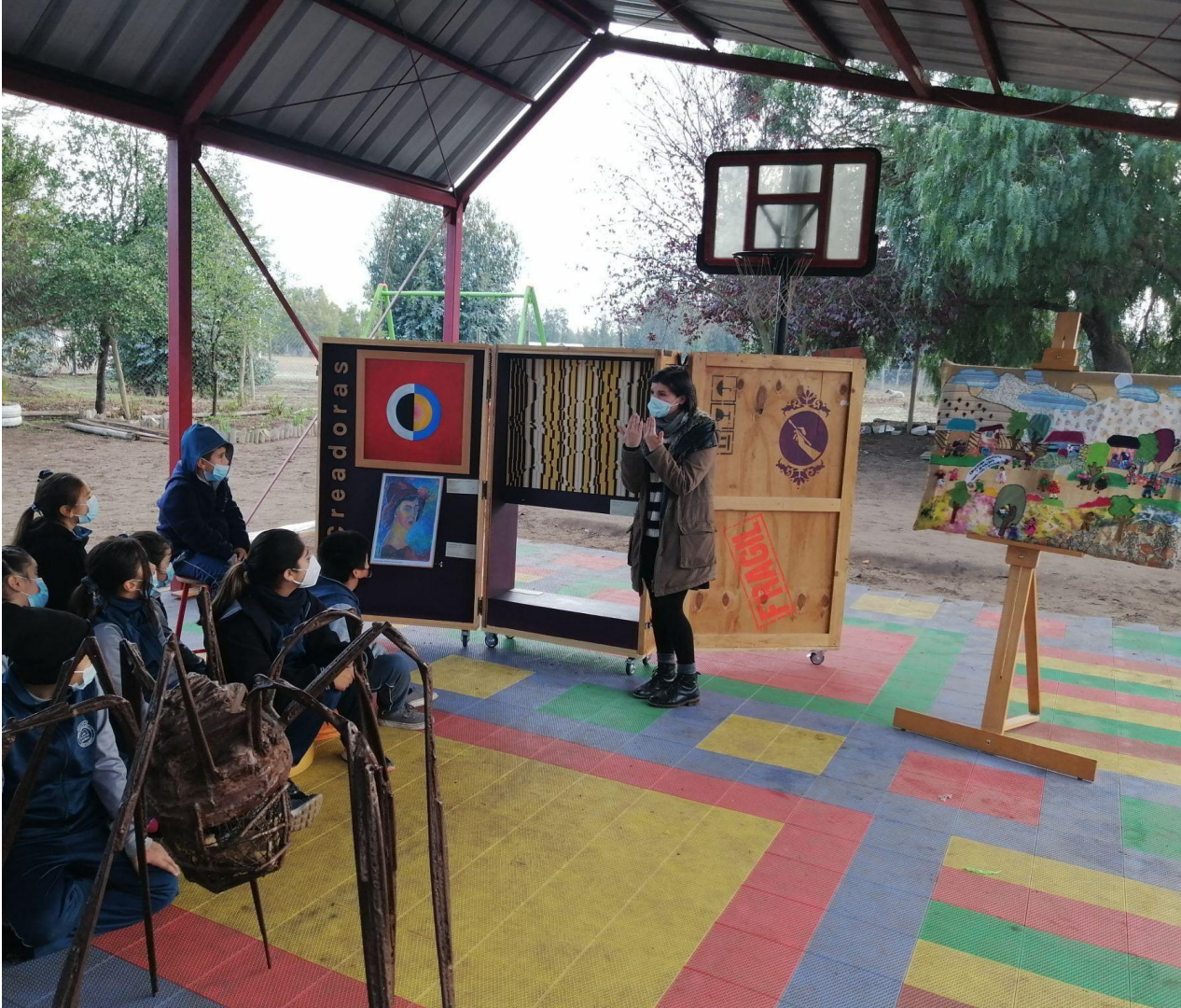
Módulo Las mujeres en el arte