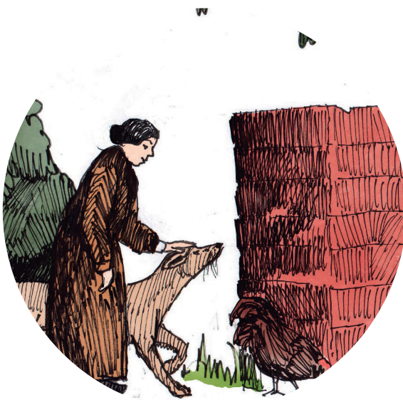
Gabriela Mistral, una niña provinciana

Para conocer más a Gabriela Mistral leeremos algunos relatos que niñas, niños y adolescentes escribieron en sus revistas escolares hace muchos años.